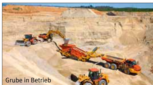
Grube in Betrieb

kurz bleiben. Drei Viertel der in Müntschemier abgebauten Rohstoffe werden in einem Umkreis von 6 km und das restliche Viertel in einem Umkreis von 10 km verarbeitet.