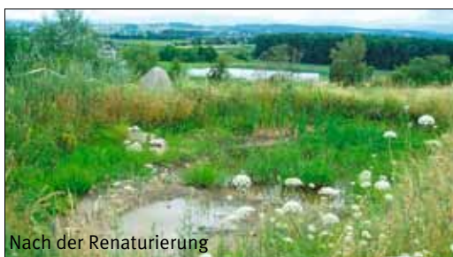
Nach der Renaturierung