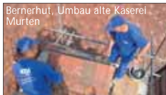
Bernerhüt, Umbau alte Käserei Murten

Eine gelebte Transparenz gegenüber den Angestellten ist sehr wichtig. Wir legen grossen Wert darauf, dass die Teams längerfristig zusammen arbeiten und beteiligen sie auch am Unternehmenserfolg. Diese Konstanz fördert das Arbeitsklima.