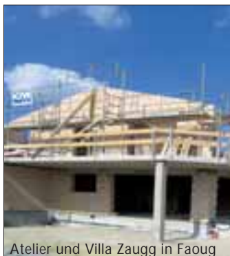
Atelier und Villa Zaugg in Faoug