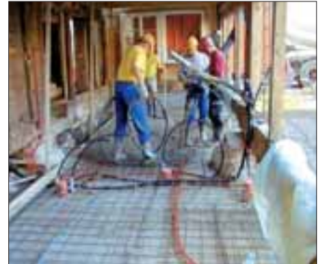
Richtig umbauen muss gelernt sein

Bebaute Grundstücke sind oftmals unterbewertet. Deshalb ist es für viele Bauwillige einfach, einen Umbau zu finanzieren. Dazu kommt, dass das Geld auf dem Kapitalmarkt derzeit auf einem historischen Tiefstand ist. Mit einem Umbau wird nicht nur eine Werterhaltung, sondern auch eine Wertsteigerung erzielt. Eine Investition lohnt sich momentan also doppelt!