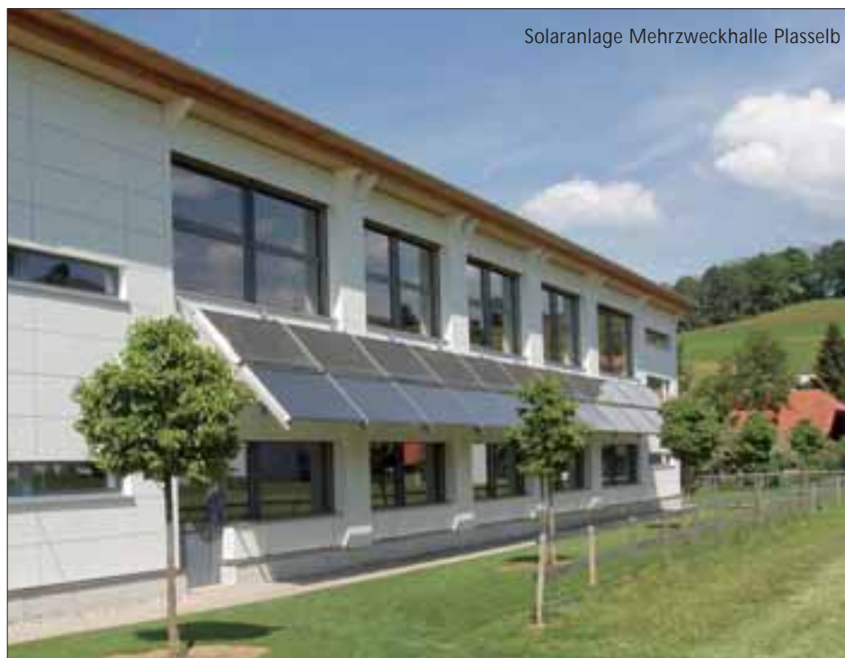
Solaranlage Mehrzweckhalle Plasselb