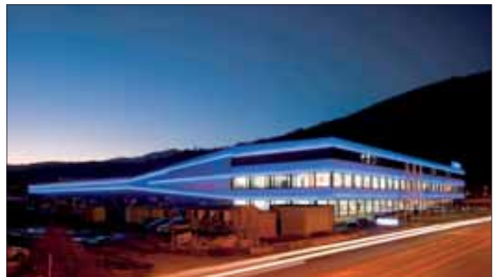
Sabag Biel, Nachtansicht:

Im Normalfall sind die anfallenden Mehrkosten jederzeit vertretbar und spielen sich durch Mehrumsatz und besser motivierte Mitarbeitende in kürzester Zeit wieder ein. Auch KMU's können auf hervorragende und eindrück-