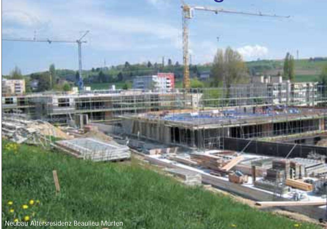
Neubau Altersresidenz Beaulieu Murten