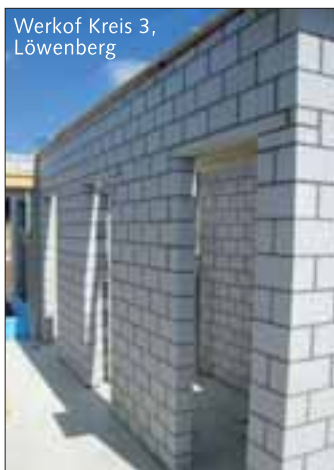
Werkof Kreis 3, Löwenberg

Zum Thema Arbeitsmotivation. Sie verfügen über viele langjährige Mitarbeiter/innen, was tun Sie, damit Ihre Mitarbeiter bei Ihnen bleiben?