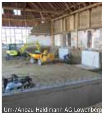
Um-/Anbau Haldimann AG Löwenberg

Auf welche Fähigkeiten und Eigenschaften legen Sie bei Ihren Mitarbeitern besonders Wert?