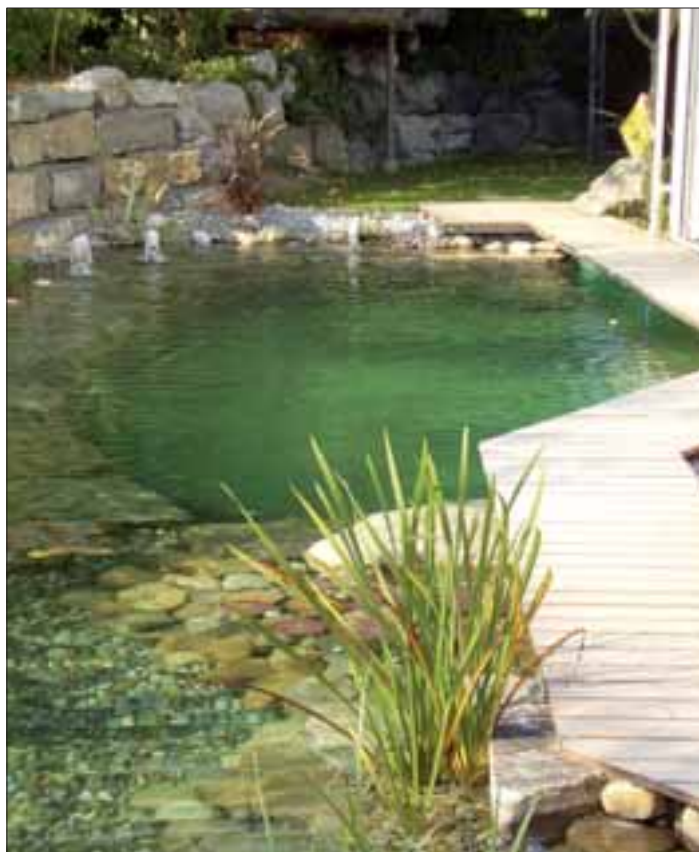
Eine kleine Auswahl der Garten- und Teichlandschaften, erschaffen durch Grün & Blau Gärten